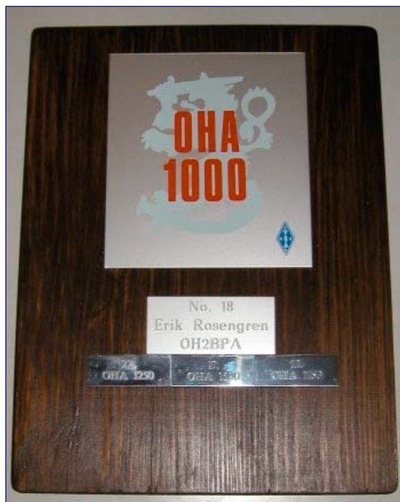
Raimon OH2LGN liitindemo + Miikan OH2LOI perhe + Erikin OH2BPA OHA-1750 avardi