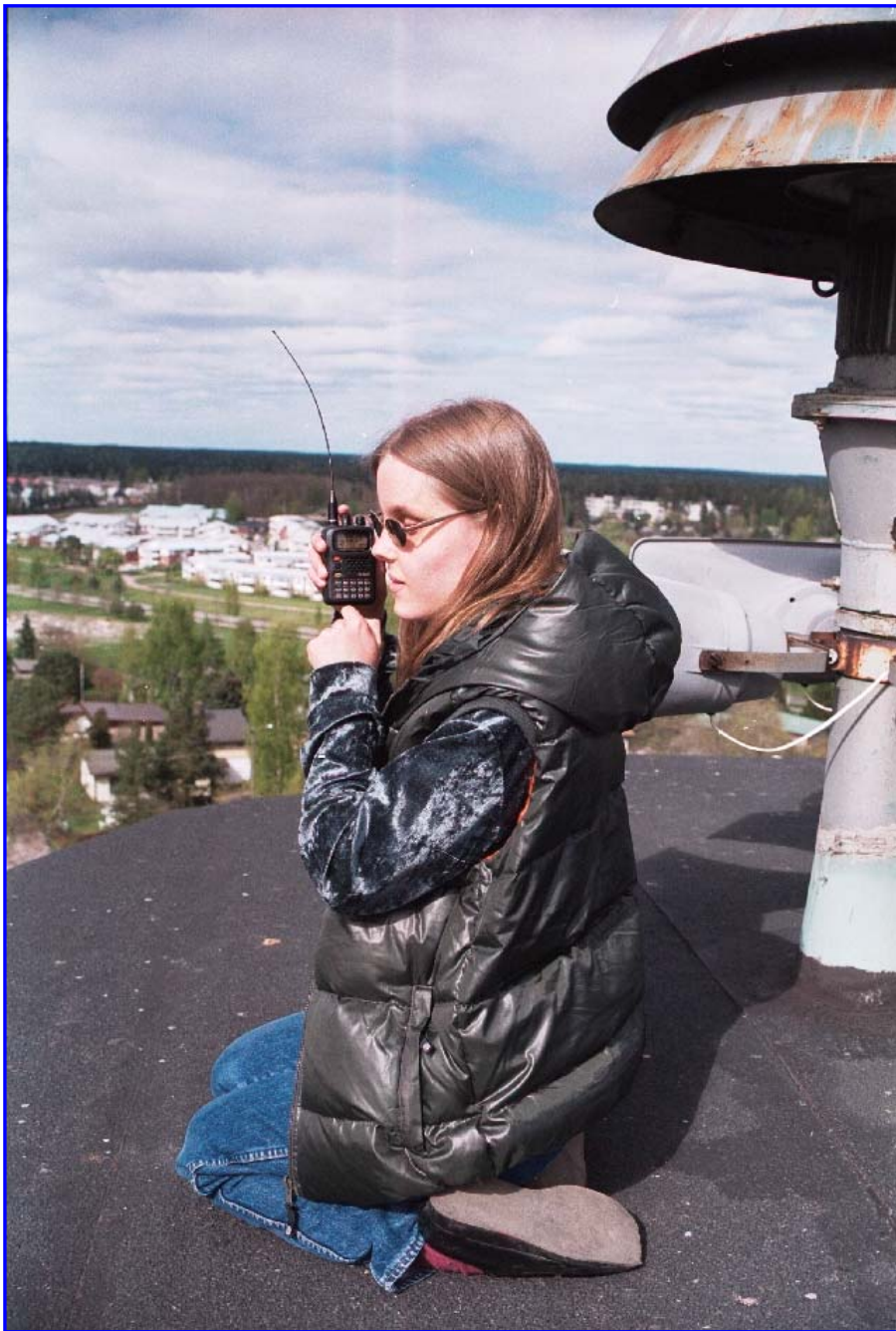
JOHANNA OH2GAV/P workkii 74 m as!